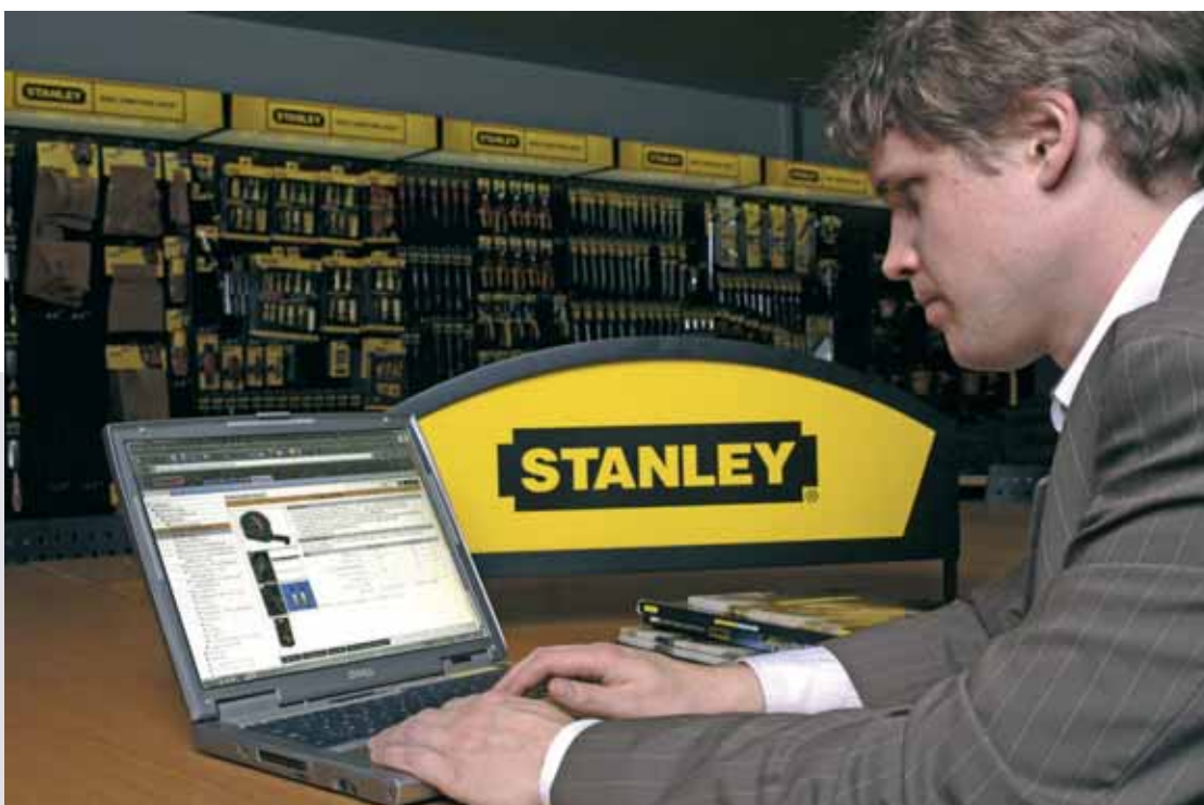
Online und Offline Werbemittel mit Hilfe von PIMS effizient erstellt

Für eine erfolgreiche Symbiose aus Markt- und Produkttreue bietet sich der Einsatz von PIMS an. Die Lösung aus dem Hause ADAM Software stellt unserem Produktmanager ein Interface des Musterkatalogs zur Verfügung. Nach dem WYSIWYG-Prinzip kann er dem Produkt