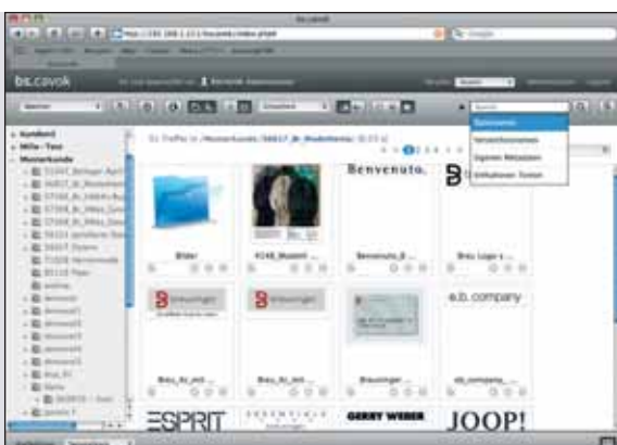
Das Media-Asset-Management System bs.cavok

Ein weiterer interessanter Aspekt der Echtzeitsynchronisierung: Sie prüft \cup